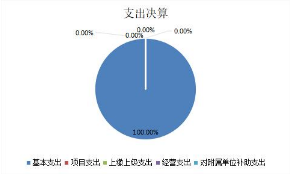
图 2：基本支出和项目支出情况

2024 年度财政拨款收、支总计 491.11 万元，比上年减少 34.81 万元，，下降 6.61%。主要原因：在职转退休 1 人，调入调出人员变化较大，导致工资基数变化大，所以比上年减少。