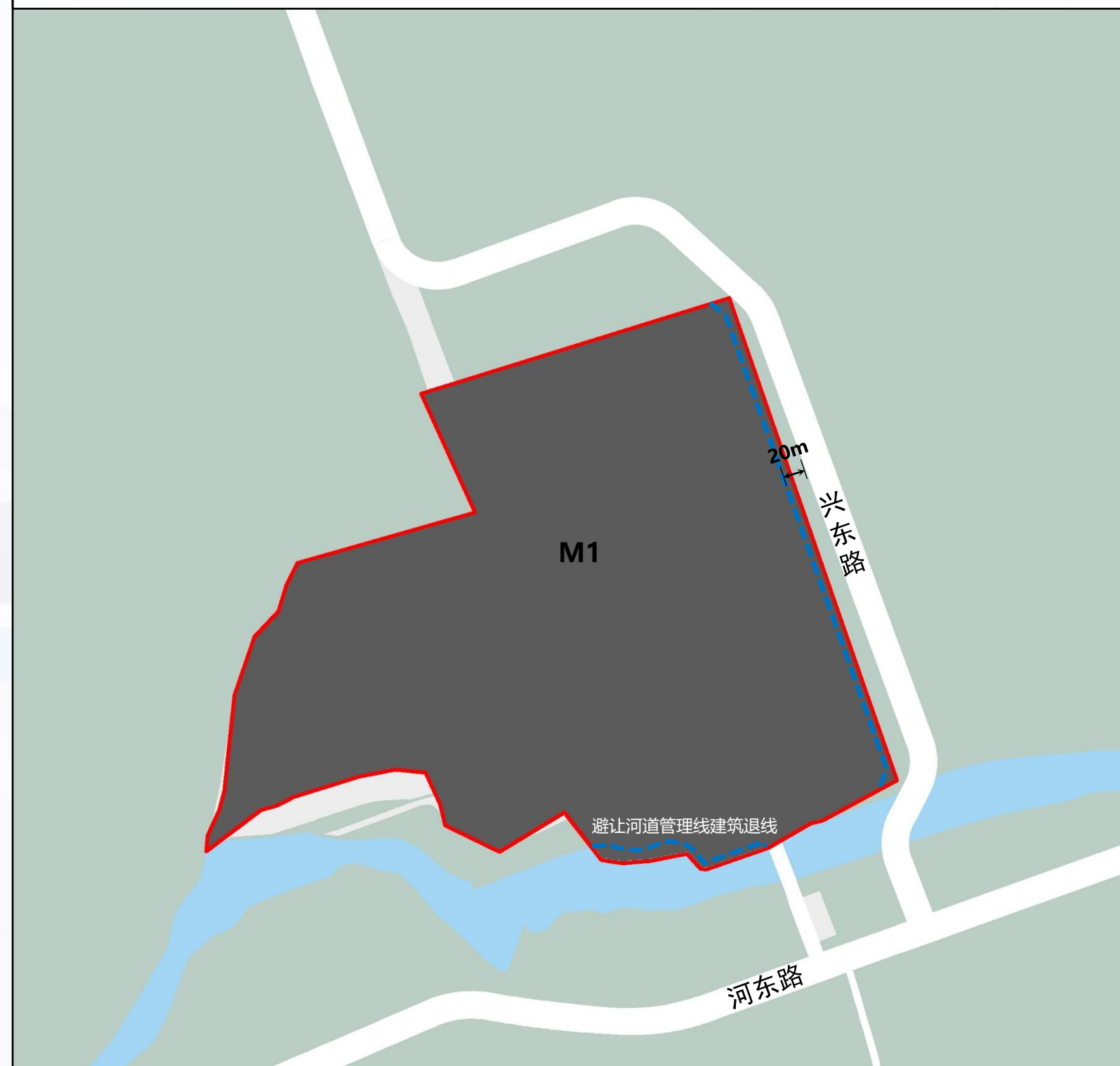
规划用地位置示意