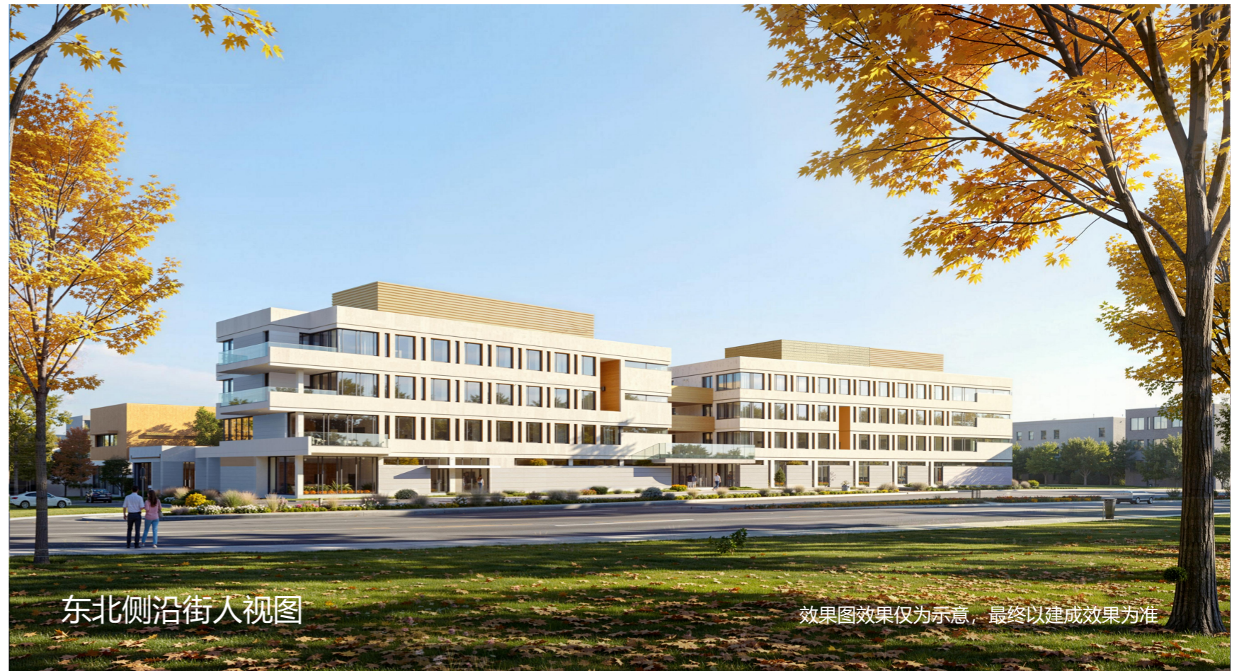
东北侧沿街人视图